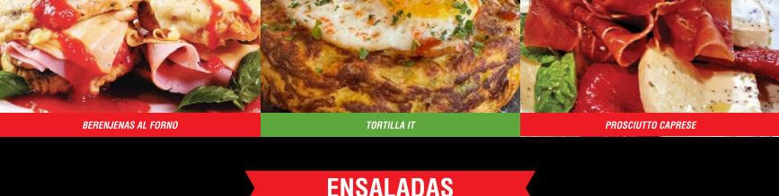
BERENJENAS AL FORNO